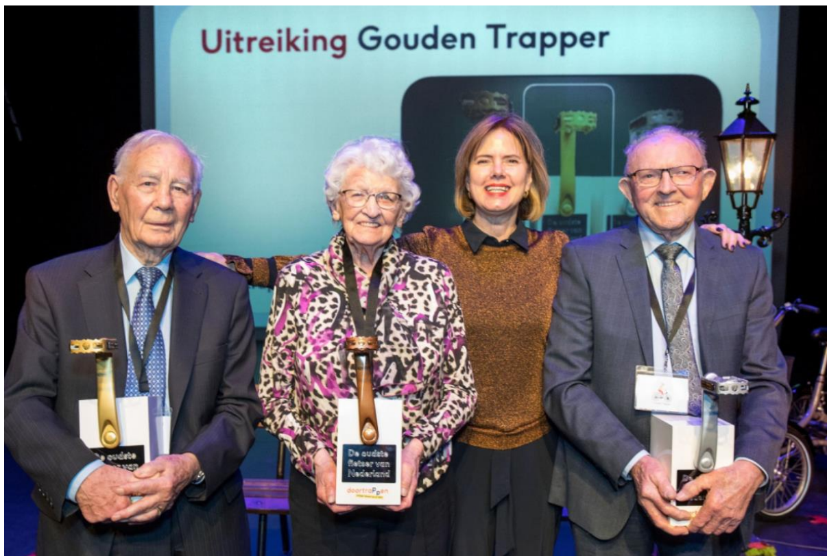
Figuur 1: De winnaars van de Gouden, Zilveren en Bronzen trappers, uitgereikt door minister Cora van Nieuwenhuizen op 12 februari 2019