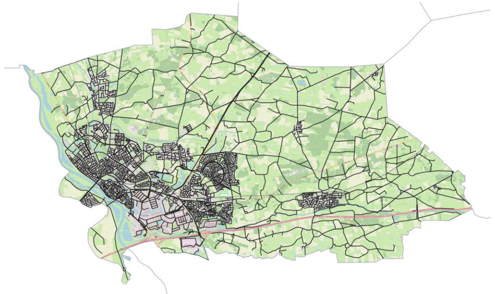
Figuur 1 Verkeersnetwerk van de gemeente Deventer met zowel een stedelijke kern, een dorpskern Bathmen, plattelandswegen als ook diverse aantakkingen op provinciale en rijkswegen.

De verkeersgegevens van het basisjaar van alle wegen die in beheer zijn van gemeenten en waterschappen worden centraal geregistreerd. Ook de met die verkeersgegevens berekende ‘basisgeluidemissie’ wordt vastgelegd. Deze registratie gebeurt in de CVGG (Centrale Voorziening Geluidgegevens) die wordt beheerd door het RIVM. Optioneel kunnen gemeenten ook een prognosejaar laten opnemen in de CVGG. Dan hoeven projectontwikkelaars die een akoestisch onderzoek moeten laten uitvoeren niet meer bij de gemeente de verkeersgegevens van het prognosejaar op te vragen.