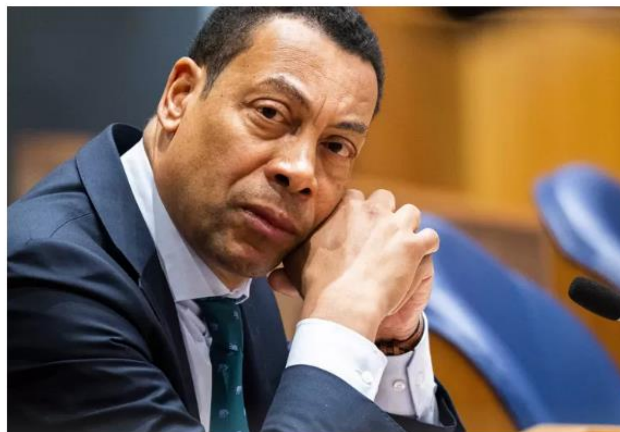
Minister voor rechtsbescherming Franc Weerwind.