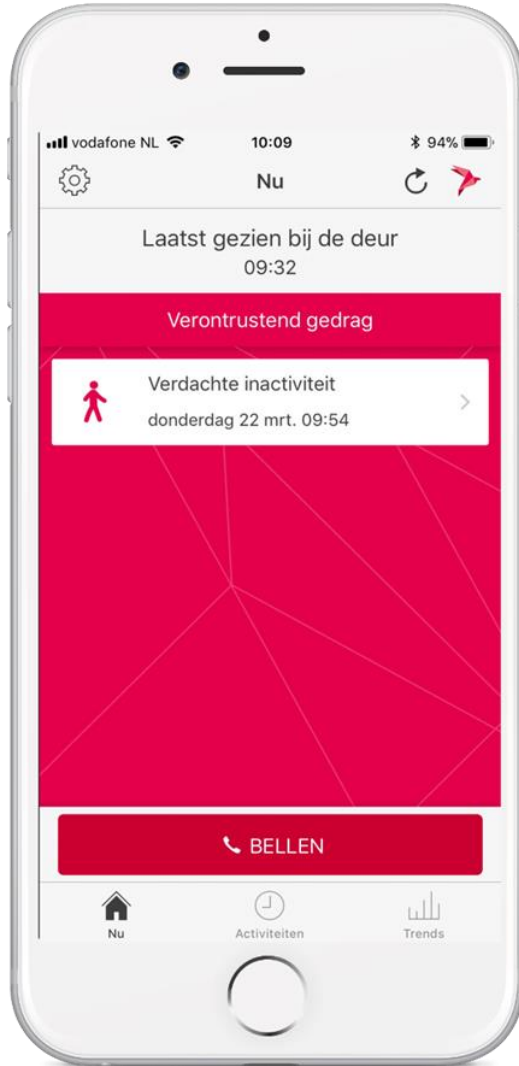
Hoe gaat het nu?