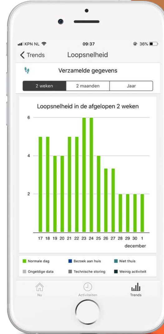
Verandert er iets?