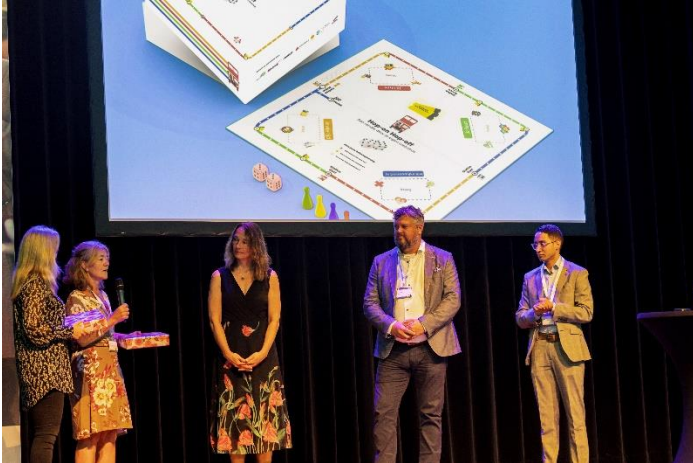
Lancering Hop-On Hop-Off spel